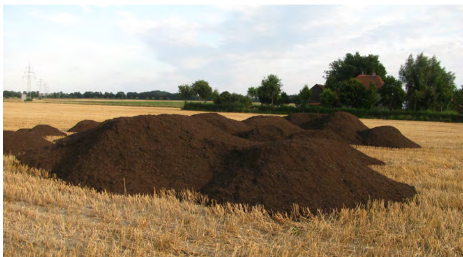
Komposte werden bevorzugt nach der Getreideernte ausgebracht. Bis auf wenige Monate im Jahr ist die Kompostausbringung ganzjährig möglich.

CO 2 -Emissionen weitgehend kompensieren, auch wenn Anreicherung und Speicherkapazität von Natur aus zeitlich und mengenmäßig begrenzt sind. Das 4‰-Ziel ist optimistisch, aber erreichbar – der Weg dorthin noch weit.