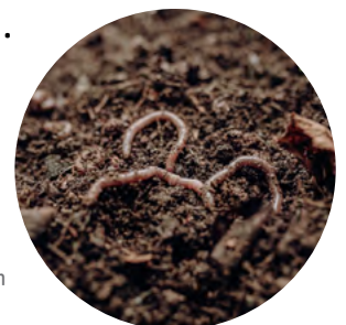
Regenwürmer – die Humushelden