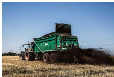
Die Düngung mit Kompost liefert Nachschub für den Humusaufbau im Boden.

In derselben Menge Humus können 75 Liter Wasser gebunden werden. Denn Humus kann das Fünffache seines Gewichtes an Wasser speichern! Einerseits nimmt das organische Material selbst Wasser auf, andererseits wird Wasser auch zwischen den mit organischem Material verbauten Bodenteilchen festgehalten. Deshalb gilt: Je mehr Humus ein Boden enthält, desto mehr Wasser kann er speichern, und zwar pflanzenverfügbar. Das ist gerade bei Extremwetterereignissen wie Dürren oder Starkregen wichtig, die durch den Klimawandel vermehrt auftreten.